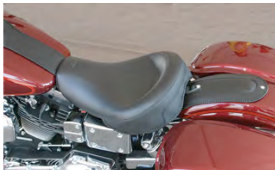
Solo with matching fender bib