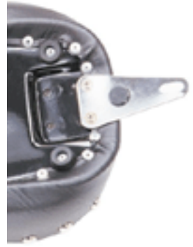
Bracket shown in Dyna Wide Glide Position